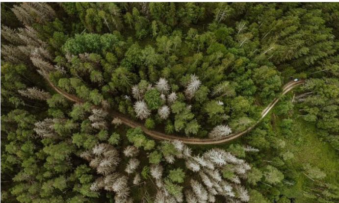
Joonis 1. Mets. (Kaasik, 2020)